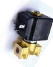
Elettrovalvola AP 1/4 230V50Hz NC-20 EVO 3.9mm NC solenoid valve 1/4" 230V50Hz EVO 3.9mm 25 bar