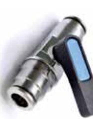
Valvola a sfera di intercettazione innesto rapido 3/8" 3/8" Tube On/Off slip lock Valve