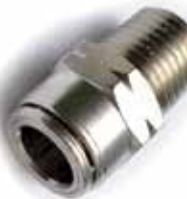
Raccordo di inizio innesto rapido 3/8" x 3/8" bsp 3/8" Tube x 3/8" BPS Male Connector