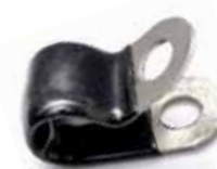
Graffa fissatubo 3/8" acciaio con guarnizione COLORE NERO S. Steel clamp for 3/8" tubing BLACK