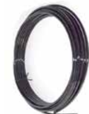
Tubo Mr. Mosquito 3/8" 40 bar nero Pa 12 - matassa 50 mt 3/8" nylon pipe PA 12 in coil 50 mt. BLACK