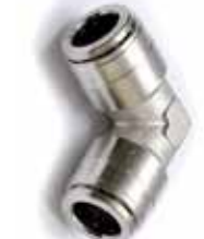
Raccordo curva 90° innesto rapido 3/8" 3/8" L Fitting