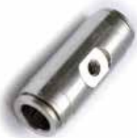
Raccordo portaugello innesto rapido 3/8" x 10/24" 3/8" Tube x 10/24" Fitting for Nozzle