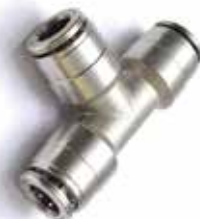
Raccordo a "T" innesto rapido 3/8" 3/8" T Fitting