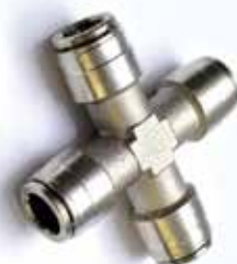
Raccordo a croce innesto rapido 3/8" 3/8" Cross Fitting