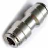
Raccordo di giunzione innesto 3/8" 3/8" Tube Coupling