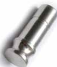
Tappo di fine linea innesto rapido 3/8" 3/8" End Plug