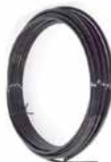
Tubo 3/8" Mr. Mosquito 40 bar Pa 12 - matassa 100 mt 3/8" nylon pipe PA 12 in coil 100 mt. BLACK