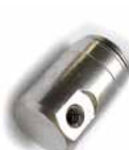
Raccordo portaugello 90° di fine linea innesto rapido 3/8" x 10/24" 3/8" Tube x 10/24" L end Fitting Nozzle